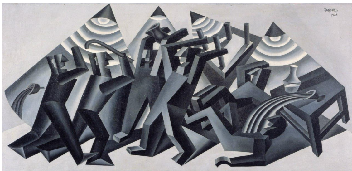
Рисунок 4 - Фортунато Деперо. Драка. 1926