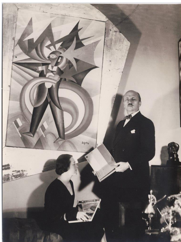
Рисунок 1 - Филиппо Томмазо Маринетти

«С самой вершины мы бросаем вызов звездам!»