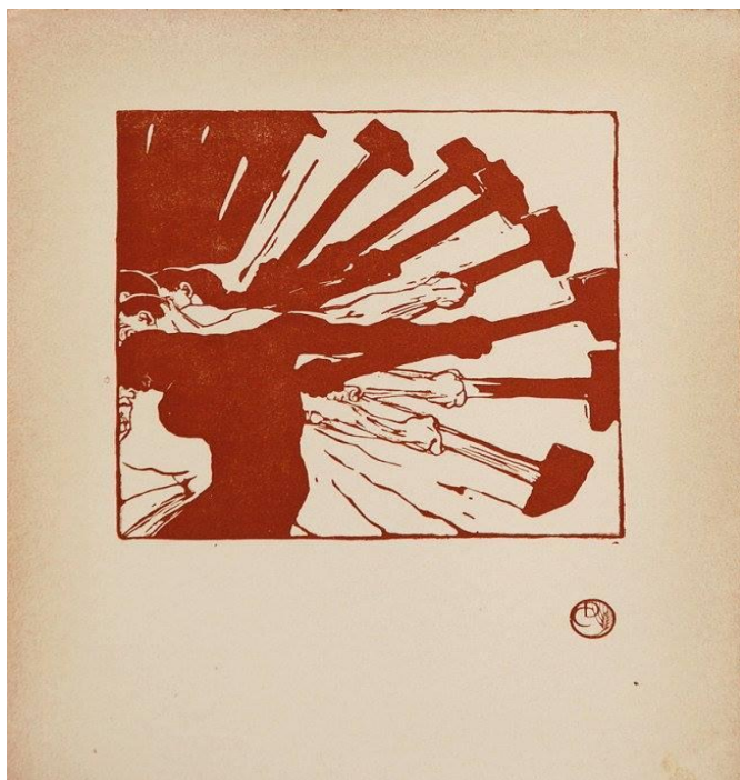
Рисунок 3 - Дуилино Камбеллотти. Динамика рабочего

любовь, сентиментальность и жалость, поскольку «теплота куска железа или дерева, волнует нас больше, чем улыбка и слезы женщины».