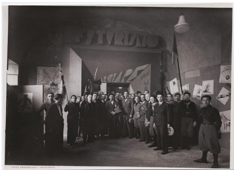
Рисунок 10 - На Национальной выставке футуристов, 1933

искусства. Союз Муссолини с Гитлером – а последний не переносил «дегенеративное» искусство – заставил Дуче избавиться от фаворитизма футуристов. Сам Маринетти в последние годы своей жизни разочаровывается в фашизме, обращается к мистике и христианству. В 1944 году Маринетти умирает, с ним умирает и футуристическое движение.