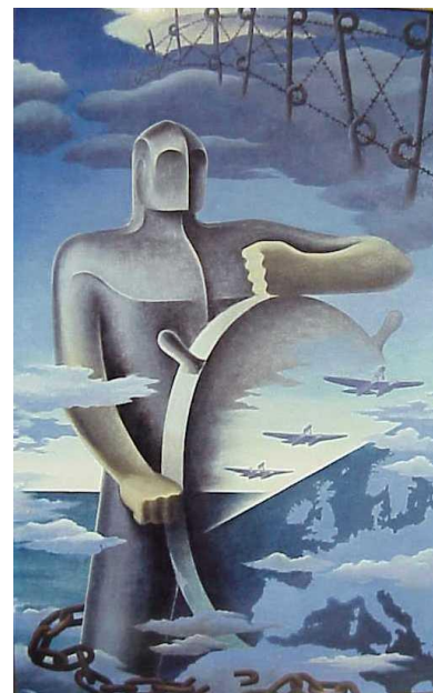
Рисунок 7 - Эрнесто Микаэллес. Великий кормчий. 1939

Например, на полотне художника Эрнесто Микаэллеса «Великий кормчий» («Il Grande Nocchiere», 1939) мы можем наблюдать образ идеального рулевого Италии, под которым, конечно же, подразумевается сам Бенито Муссолини. Художник использует тут стандартный футуристический эстетический код: апогей торжества техники и механизации человеческого тела, союз стали и воли. Таким был идеал нового человека для итальянских футуристов 1930-х годов. Фигура рулевого-дуче натянута как струна, он смотрит вдаль, в скорое будущее, уверенно стоит у руля, скованный железной цепью со своим народом. Его Путь сопровождает стройный ряд самолетов, еще одних часто воспеваемых футуристами чудес торжества техники. Тема авиации у футуристов вылилась в отдельное течение – аэроживопись.