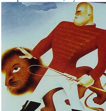
Рисунок 6. - Паоло Гаретто. Муссолини и Иудейский лев

В 1915 году Маринетти знако́ится с Бенито Муссолини, с которым у них завязывается дружба. Футуристы разглядели в Муссолини «человека истинно футуристических устремлений». «Приход к власти фашизма означает реализацию футуристической программы-минимум» —объяснял Маринетти. В 1918 году Маринетти и товарищи создаю́т «Политические футуристические фашии» и «Ассоциацию итальянских ардити (смелчак)». В своей программе они всё так же воспеваю́т героизм, борьбу за Новую Италию и социальную справедливость. Эти боевые отряды футуристов, послужили образцом для Муссолини, а все требования футуристов вошли в программу фашизма. Футуристы задавали тон и стиль новой идеологии, они её эстетизировали. Футуристическая концепция человека будущего, отвага, риск, мужество и авантюризм органично вписывались в фашистский дискурс – чёрные рубашки, отважные «ардити» с кинжалами в зубах, бросающие вызов смерти с кличем « Me ne frego! » («мне плевать»), милитаристская тематика и, конечно же, образ Дуче, «отца итальянской нации». Всё это служило вдохновением для многих футуристов, подталкивая их творчество к прославлению фашистского режима Муссолини. Особенно это сильно отображалось в изобразительном искусстве. У второго поколения футуристов(1925-1943), одной из главных тем являлся образ Муссолини, вождя фашистской революции, того самого ницшеанского «сверхчеловека», мужественного и сильного.