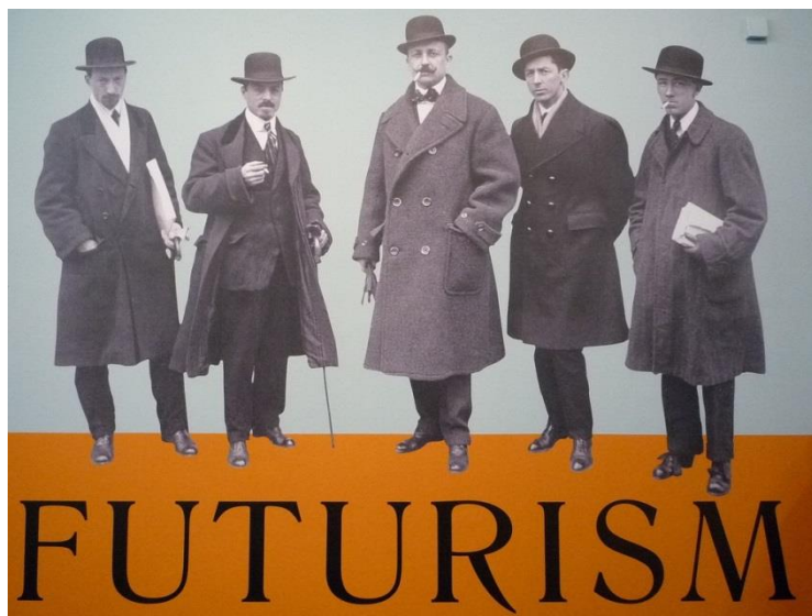
Рисунок 2 - Луиджи Руссоло, Карло Карра, Маринетти, Умберто Боччони, Джино Северини, 1909

«Манифест футуризма» отрицал духовно-культурные, художественные и этические ценности прошлого и призывал «плевать на алтарь искусства», разрушать библиотеки и музеи: «А ну-ка, где там славные поджигатели с обожжёнными руками? Давайте-ка сюда! Тащите огня к библиотечным полкам! Направьте воду каналов в музейные склепы и затопите их! Пусть течение уносит древние полотна! Хватайте кирки и лопаты! Крушите древние города!».